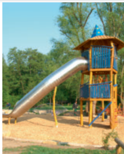
Der Turm mit dem blauen Zauberhut