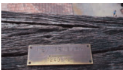
NEU-ISENBURG 1240 KM

Ich traute meinen Augen nicht, als ich zwischen Berlin und New York in gleicher Größe den Wegweiser „Neu-Isenburg“ entdeckte.