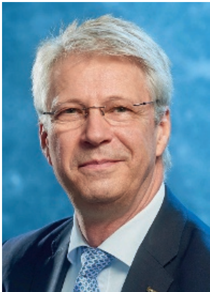
Thomas Reiter erster deutscher Astronaut, der im Weltraum ausstieg